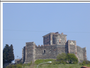
Il Castello di Arzignano - Vista da sud.

Piazzale della Vittoria, il nuovo parcheggio, la Chiesa di S. Maria ed Elisabetta e le case del borgo.