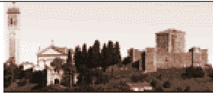
Il profilo di Castello di Arzignano con la Rocca scaligera e la Chiesa di S. Maria ed Elisabetta.

All'interno si trova la Rocca scaligera , ora abitazione del Parroco, cui bisogna rivolgersi per la visita.