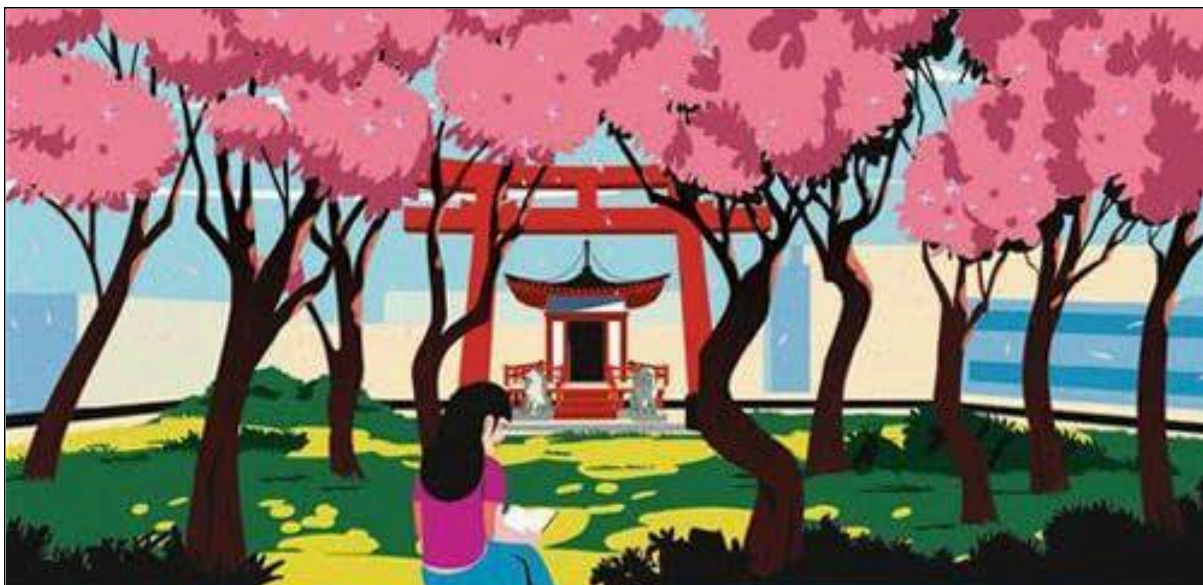
Il giardino dei piccoli addii - Yuu Nagira

Un romanzo sul potere delle relazioni , sulla rinascita , sul coraggio dei piccoli addii.